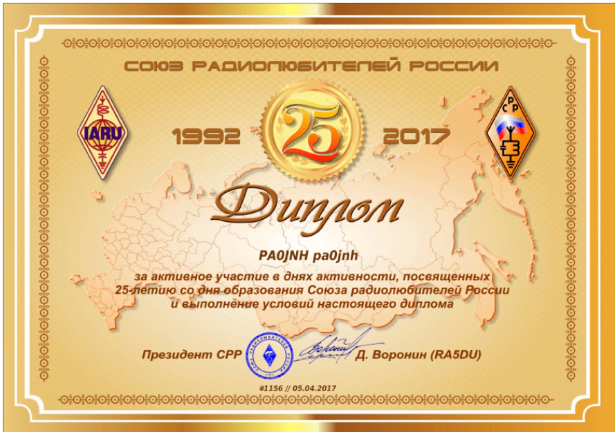
[2] - Award ter gelegenheid van het 25 jarig bestaan van de Russische Amateur Radio Union (SRR). Deze nieuwe vereniging ontstond, na het uiteenvallen van de Sovjet Unie, in 1992. Er was tussen 1 en 30 april 2017 een groot aantal stations met bijzondere roepleetters (met o.a. de prefix RO25) actief.