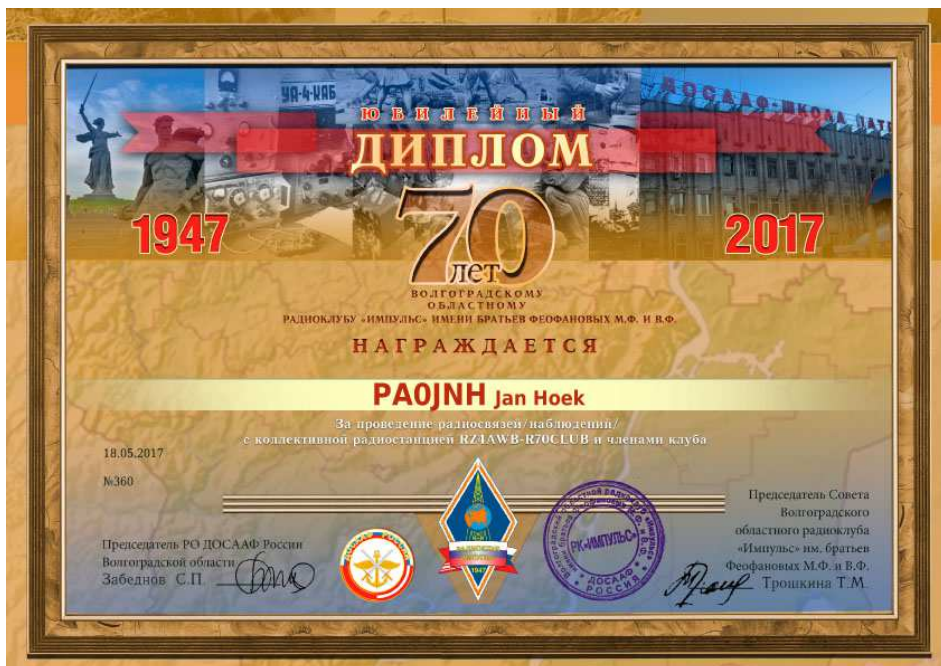
[16] Award uitgegeven door de Radioclub Impuls in Volgograd ter viering van het 70 jarig bestaan van deze radioclub. Het station R70CLUB was actief in de periode 13 - 28 mei 2017.