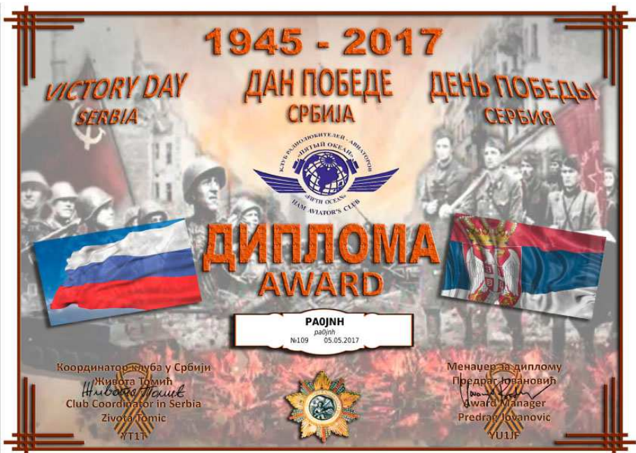
[3] - Award ter gelegenheid van de viering van 72e verjaardag van de bevrijding van Joegoslavië op 9 mei. Tussen 1 en 15 mei 2017 waren enkele stations actief, waaronder twee met bijzondere roepleetters YU7LP en YU72AV.